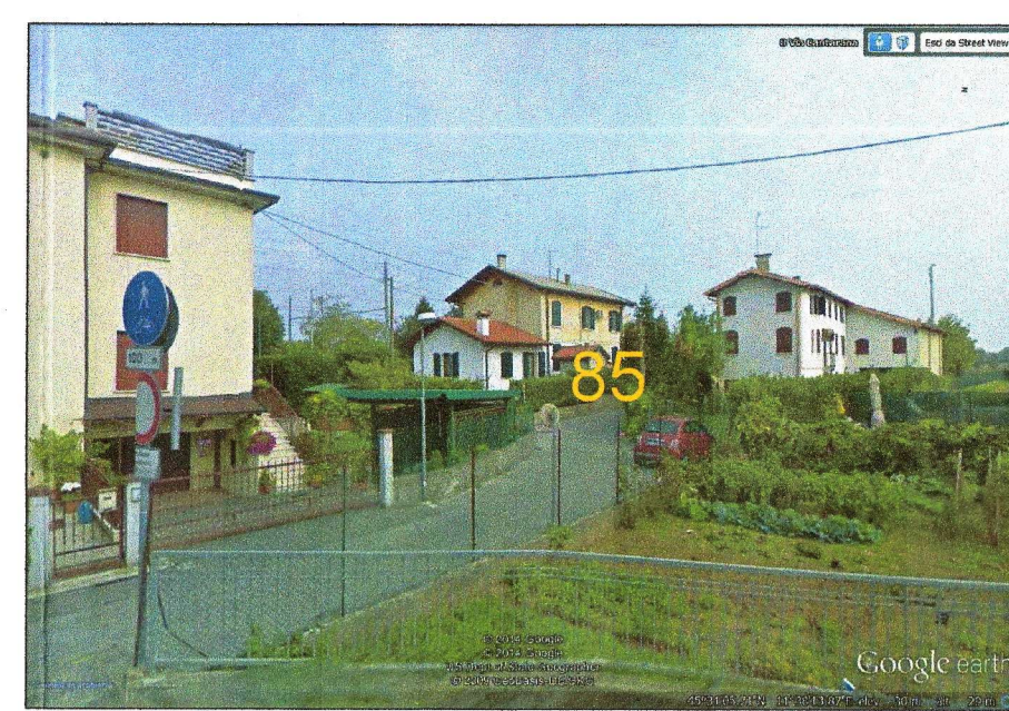
85 - STAZIONE LERINO FABBRICATO DA DEMOLIRE