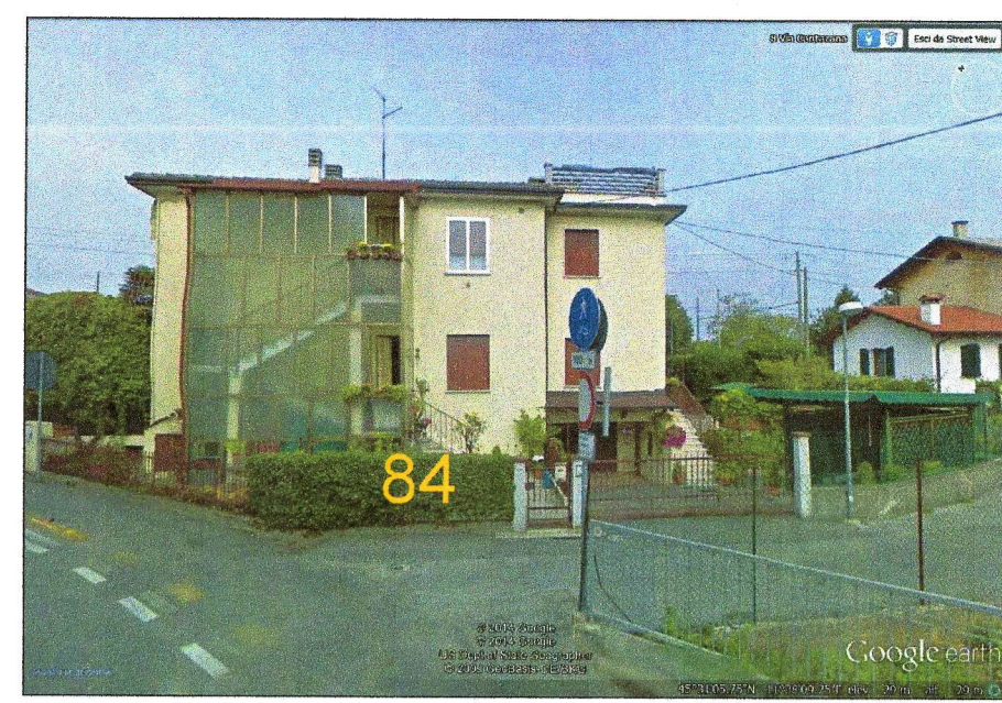
84 - STAZIONE LERINO FABBRICATO DA DEMOLIRE