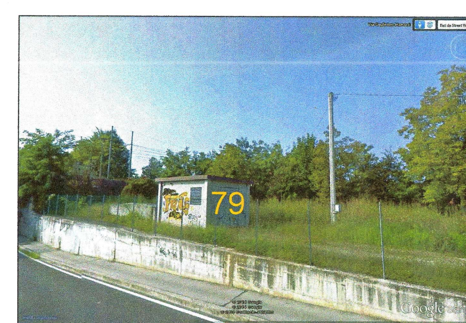
79 - FABBRICATI DA DEMOLIRE