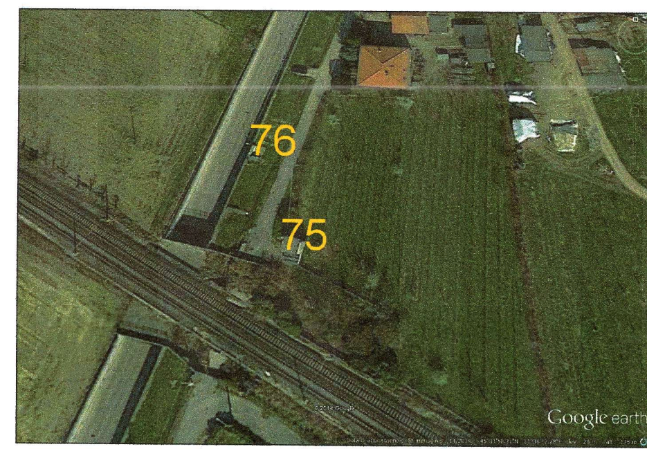
75-76 - FABBRICATI DA DEMOLIRE