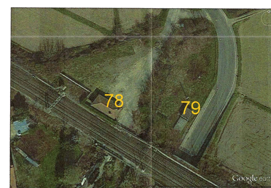
78 - FABBRICATI DA DEMOLIRE