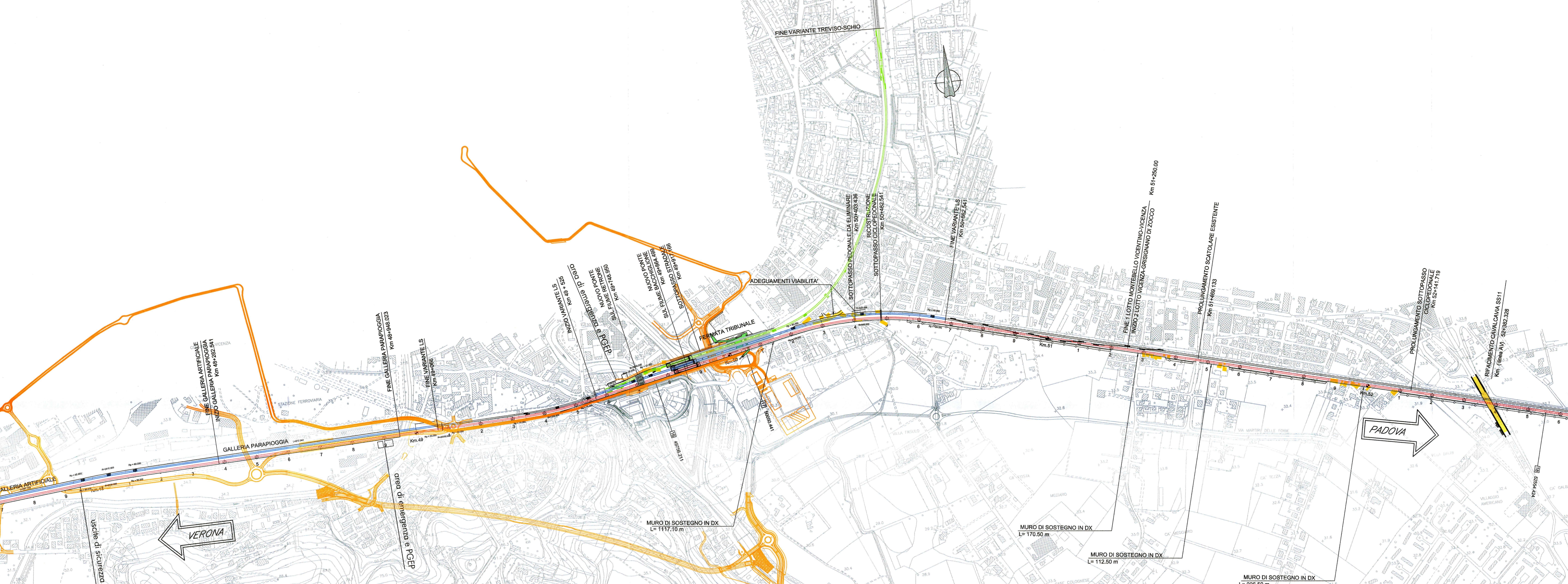
PLANIMETRIA scala 1:5000