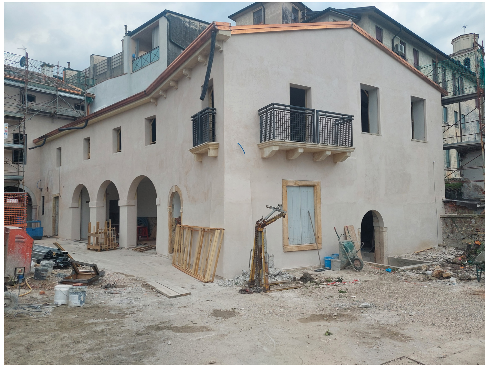
Restauro in corso d'opera