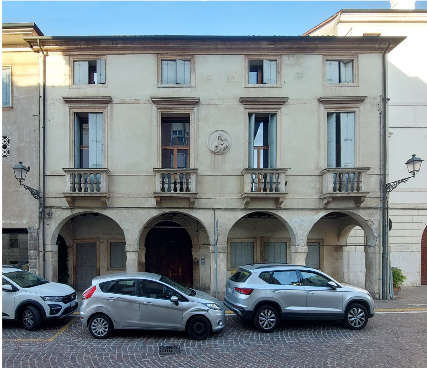
Prima del restauro