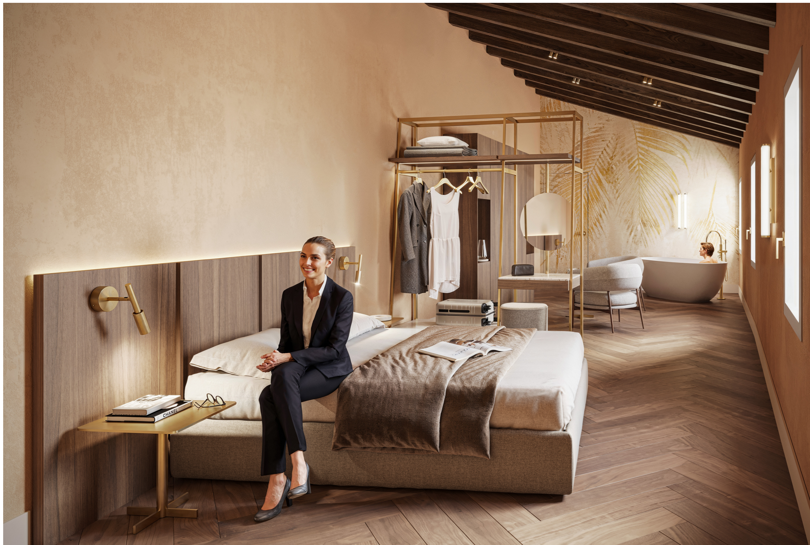
Vista interna di una camera