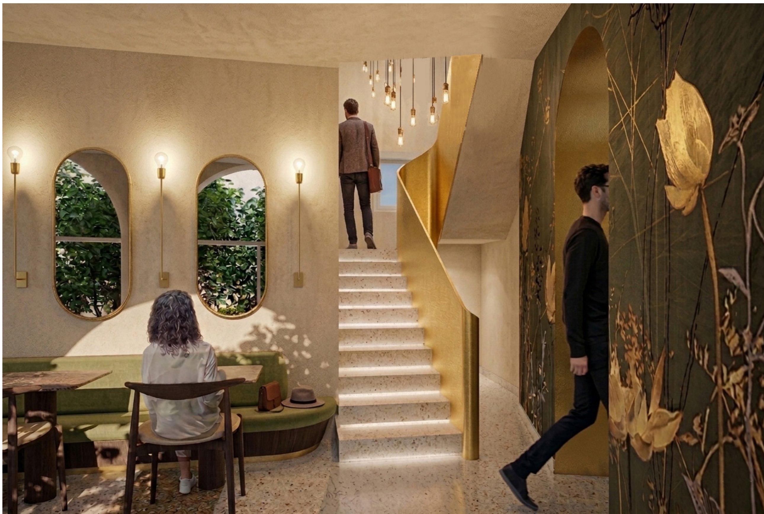
Vista interna della scala che conduce alle suites