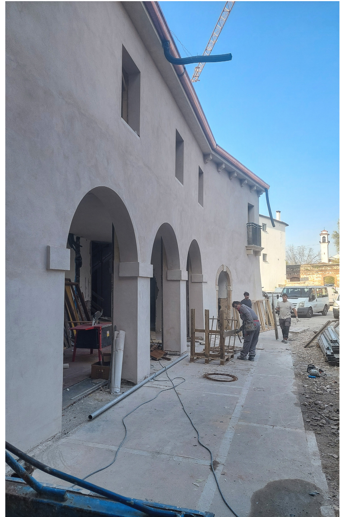
FOTO DEL CANTIERE