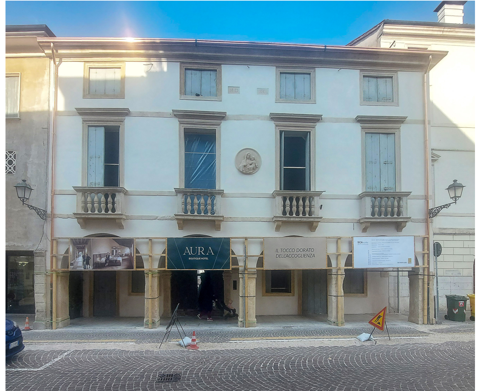
Restauro in corso d'opera