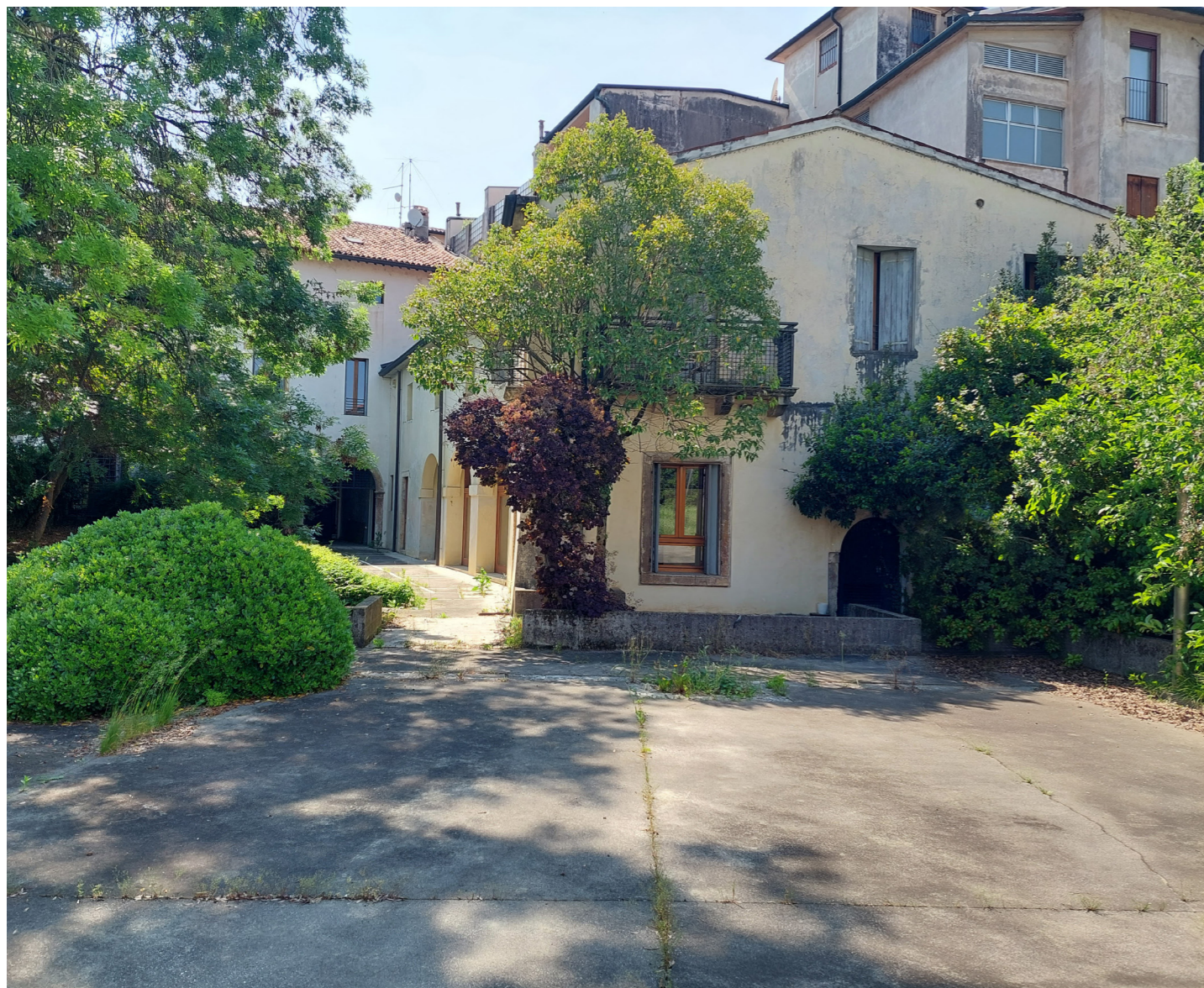
Prima del restauro