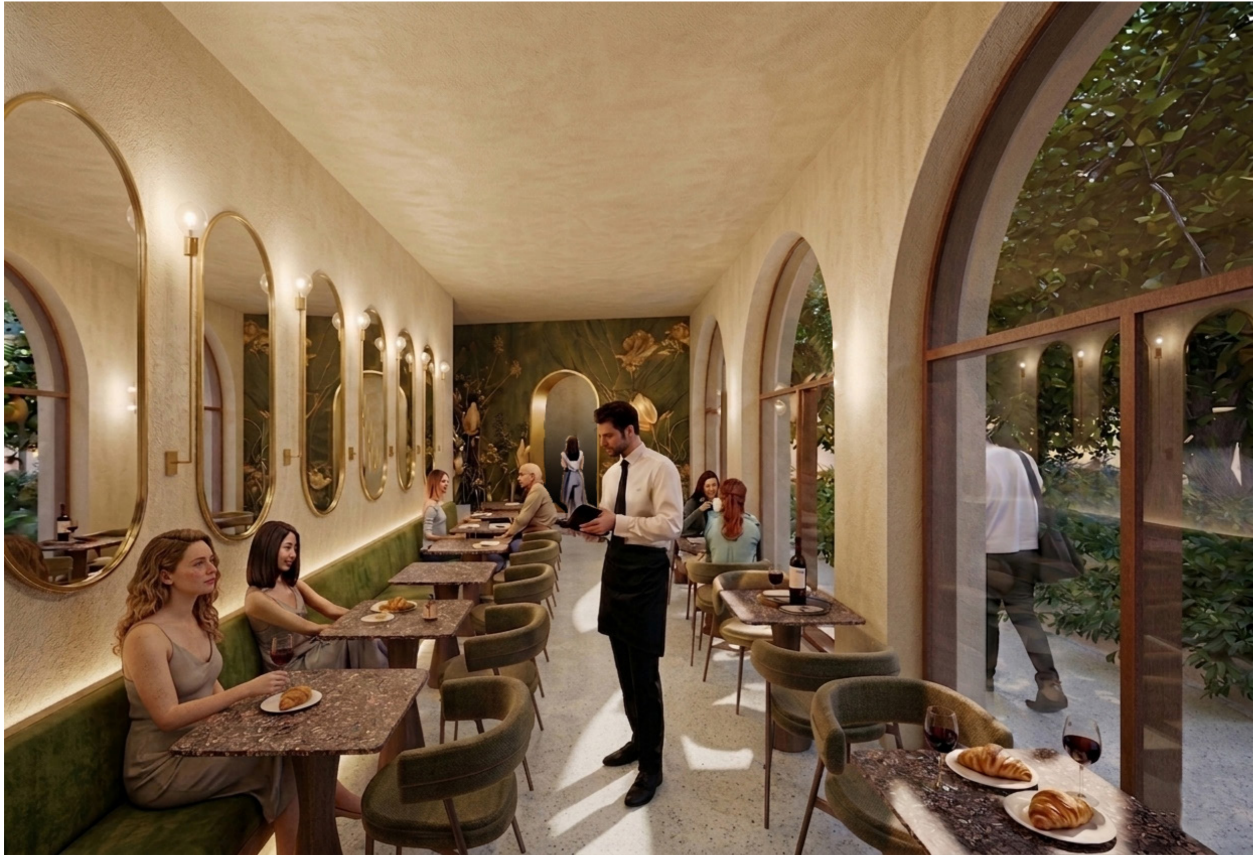
Vista interna della cafeteria al piano terra