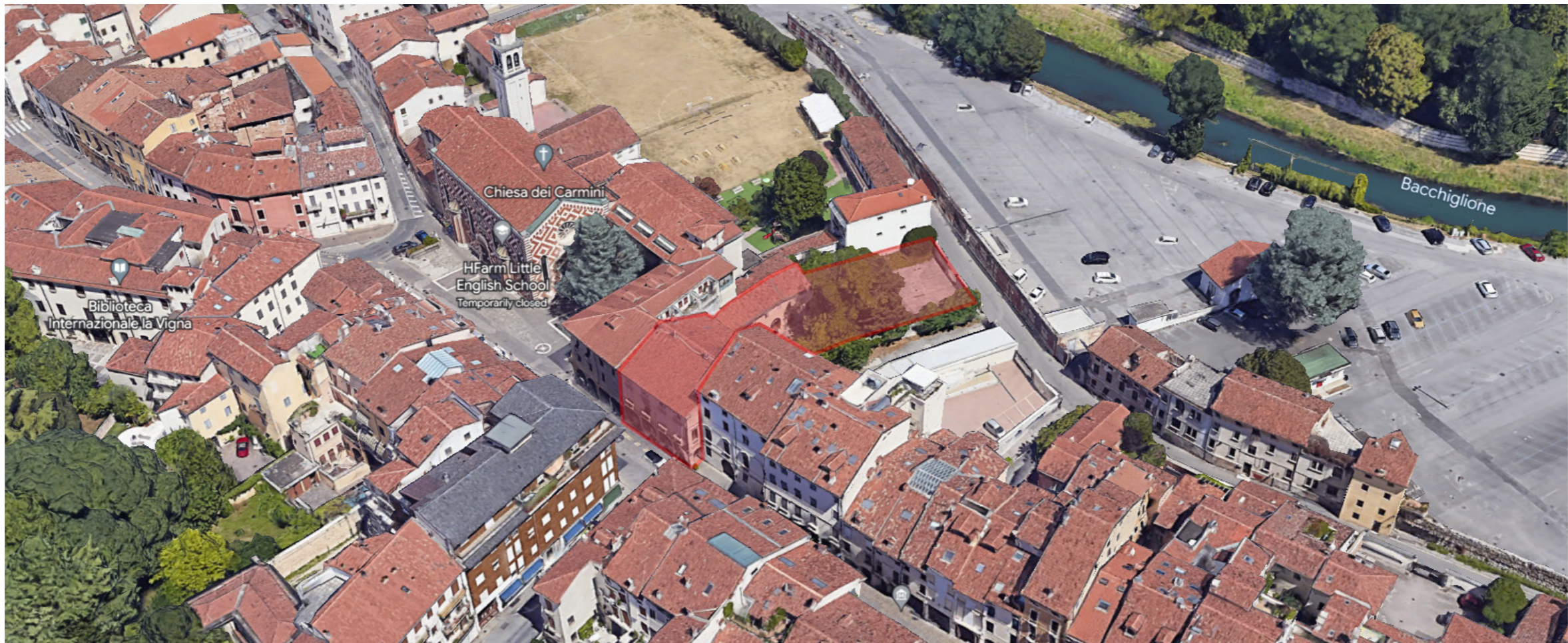
Sito di intervento