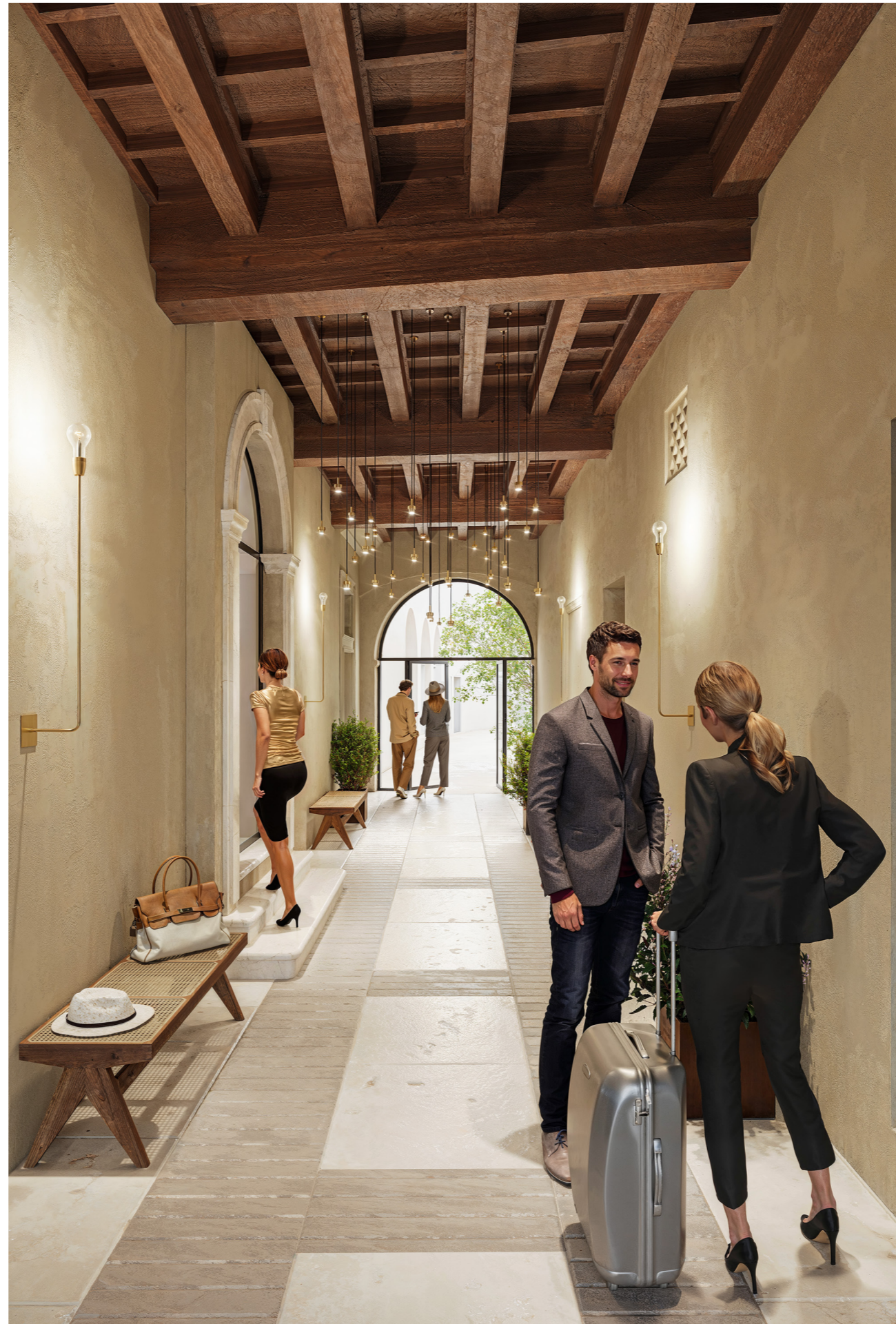
Vista dell'androne d'ingresso da Corso Fogazzaro