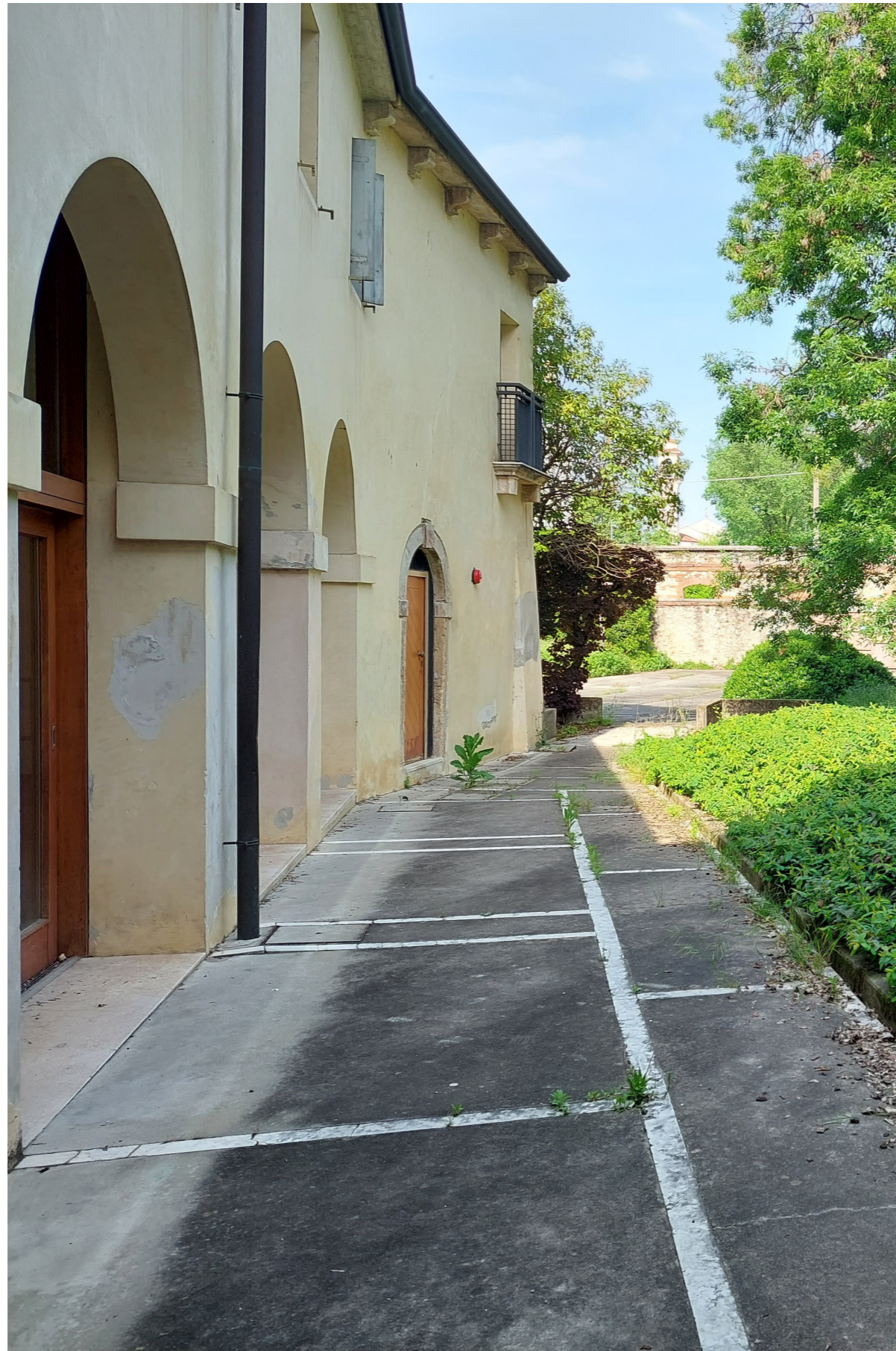
Prima del restauro