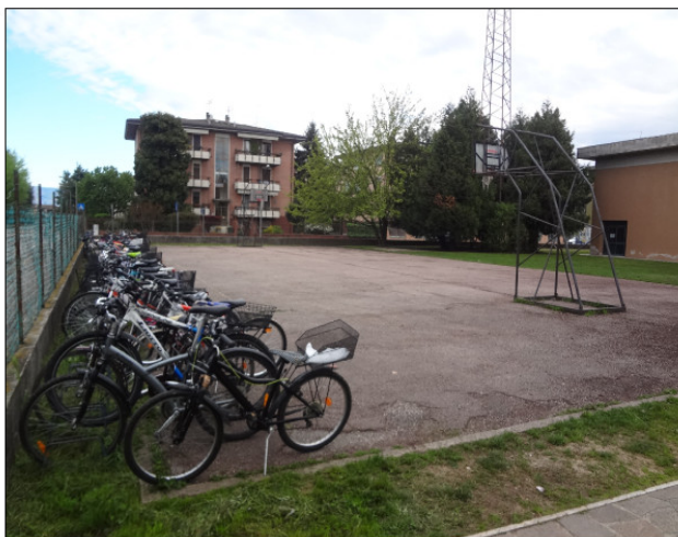
CORTILE NORD | STATO DI FATTO