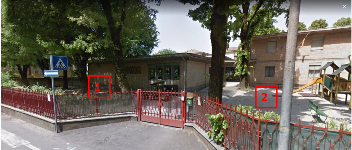
1 Educazione stradale e mobilità ciclistica