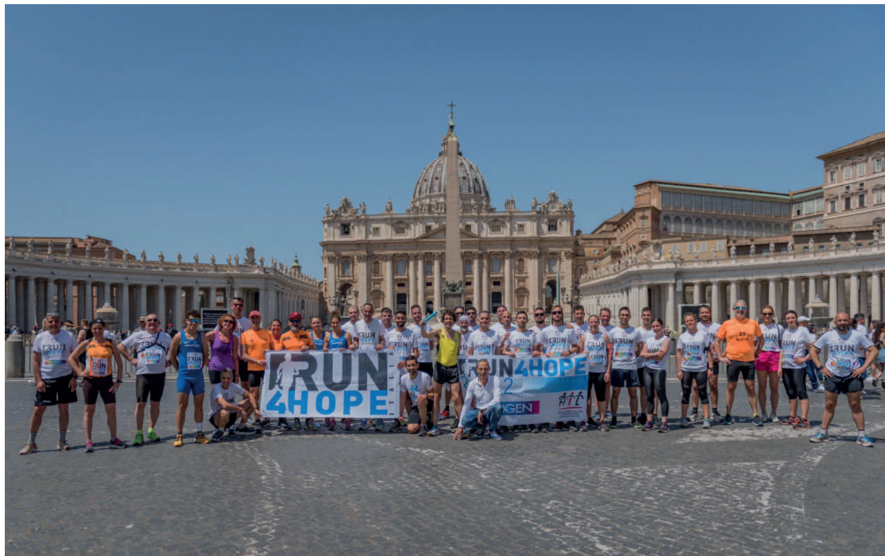
Arrivo in Piazza San Pietro della tappa inaugurale di Roma dopo la partenza da Piazza del Campidoglio

Nelle prime tre edizioni, il testimone della Run4Hope è transitato in tutte e 20 le regioni d'Italia esaltando le bellezze culturali e paesag-gistiche nazionali, comprese le piazze più iconiche, mediante tappe giornaliere comprese tra i 50 e i 100 km .