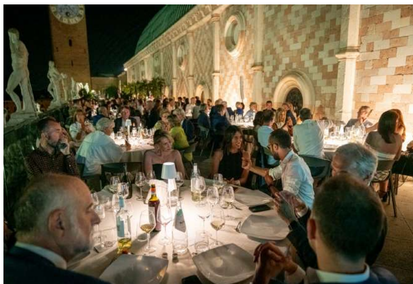
Charity Dinner 2023