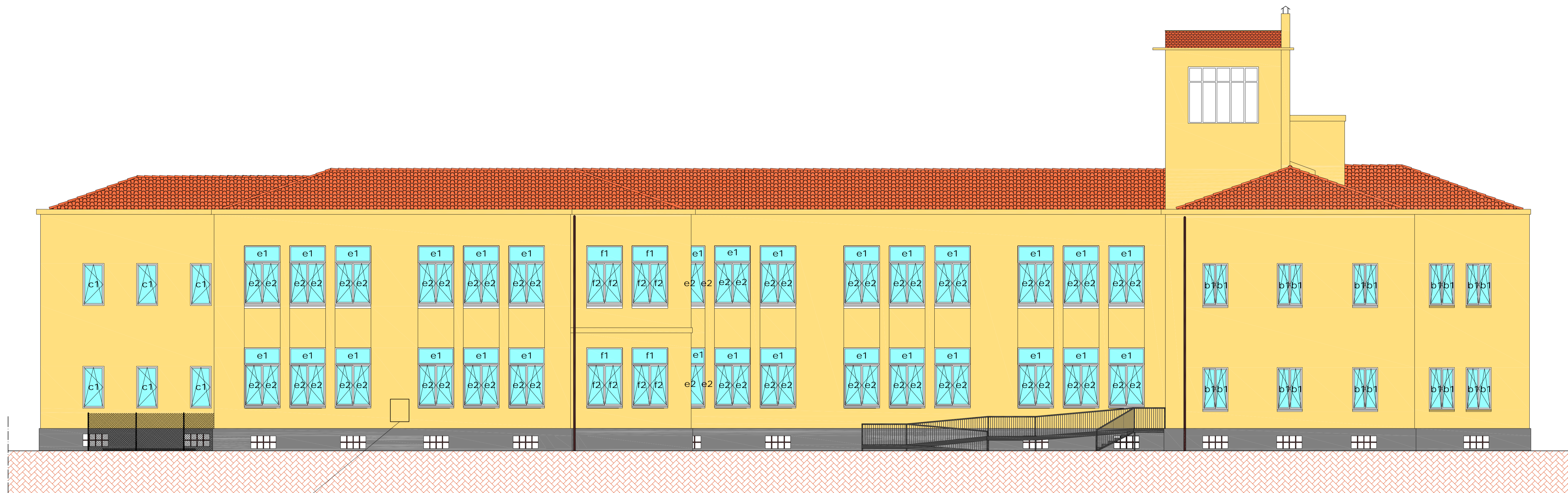
PROSPETTO EST vista dall'interno del cortile scala 1:100