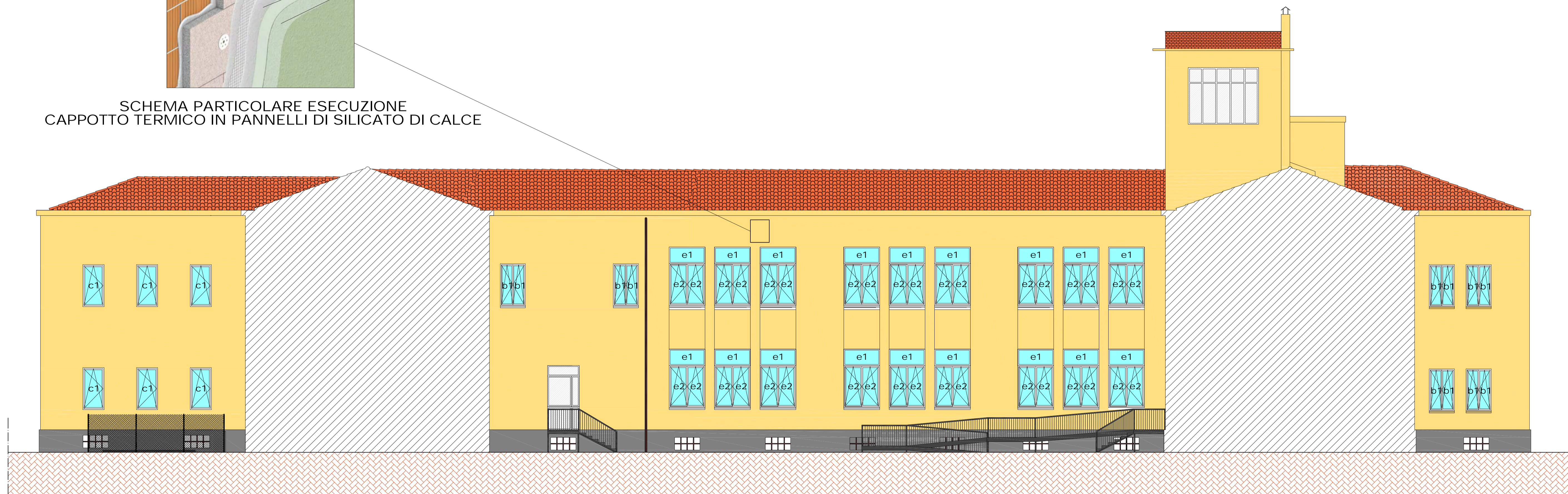
PROSPETTO EST SEZ. D-D vista dall'interno del cortile scala 1:100