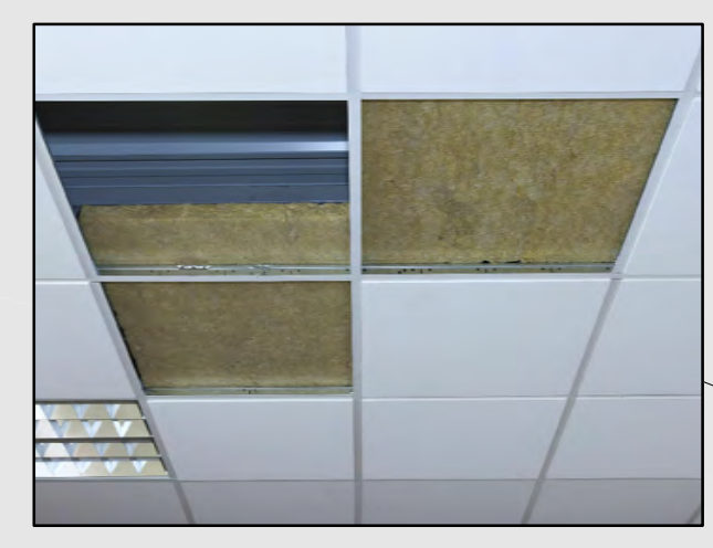
ESEMPIO DI CONTROSOFFITTO IN PANNELLI DI LANA MINERALE