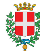
Comune di Vicenza