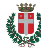
Comune di Treviso