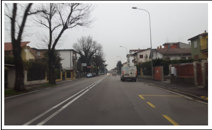
Viale dal Verme