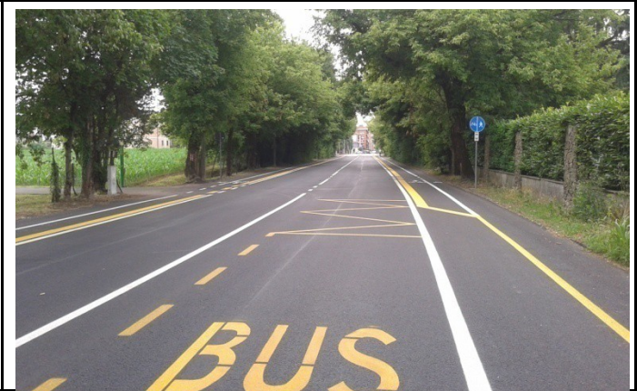
Via dei Laghi