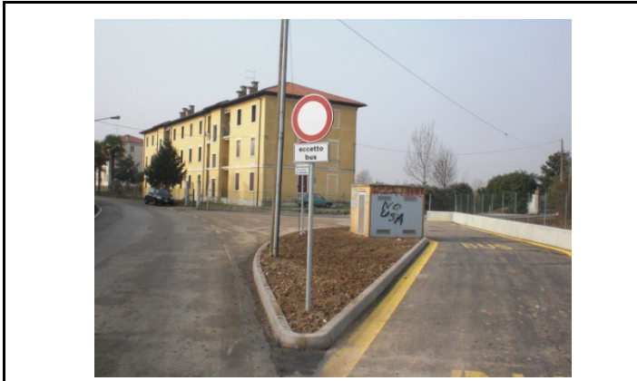
Capolinea BUS Polegge