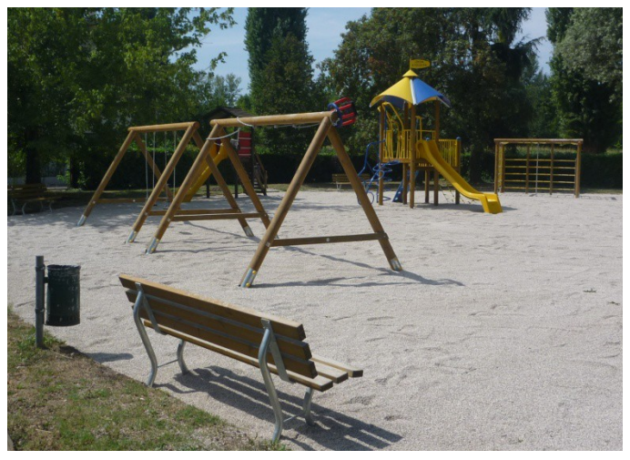
Sistemazione parchi gioco