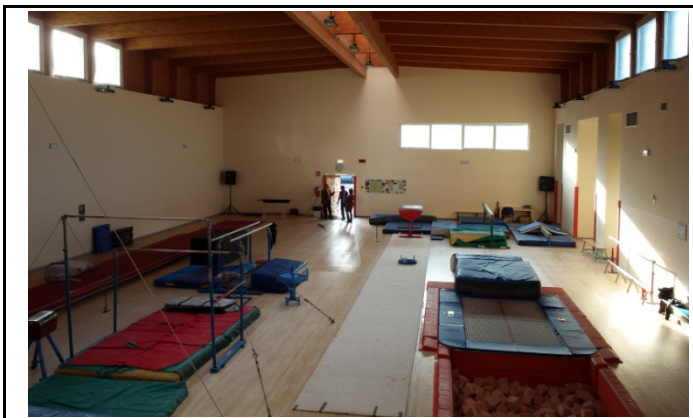
Palestra ginnastica artistica