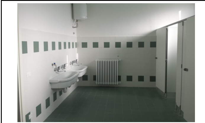
Scuola Prati - bagni