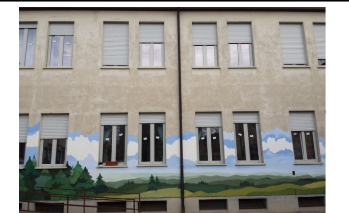
Scuola Prati - infissi