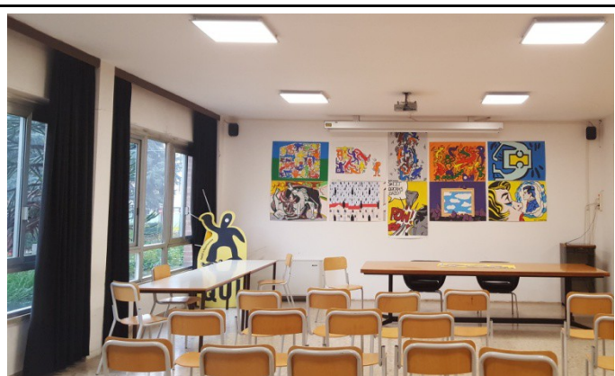
Scuola Media Trissino