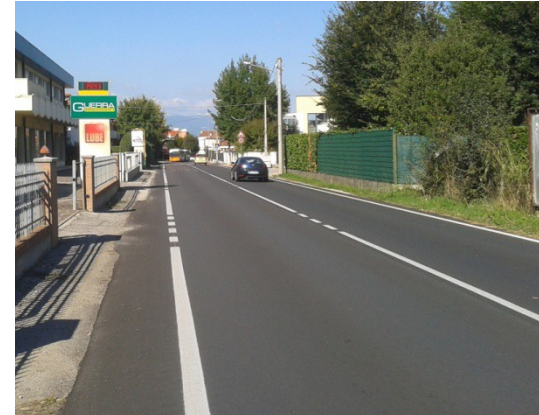
Strada di Saviabona