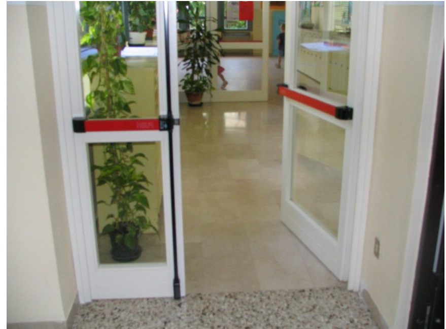
Scuola infanzia Saviabona