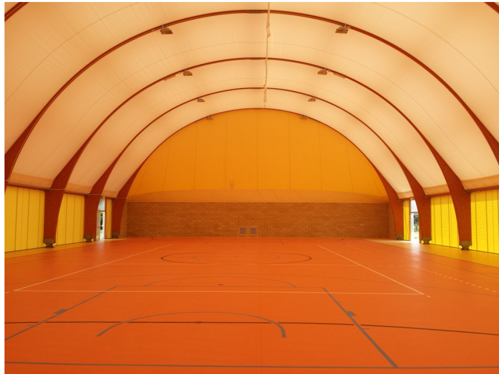
Nuova tensostruttura di Ospedaletto con spogliatoi