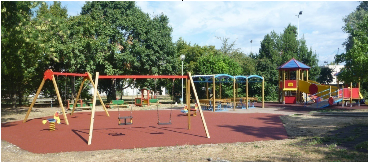
Villaggio del Sole