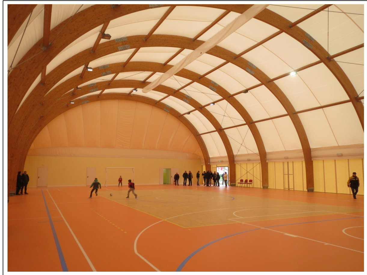
tensostruttura di Maddalene