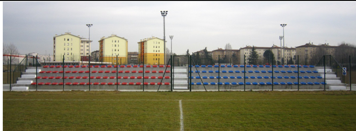
tribune campo da calcio “Pomari”