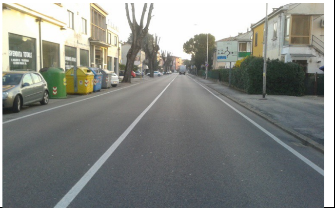
via Pecori Giraldi