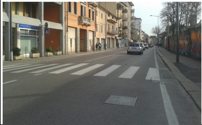
corso SS Felice e Fortunato