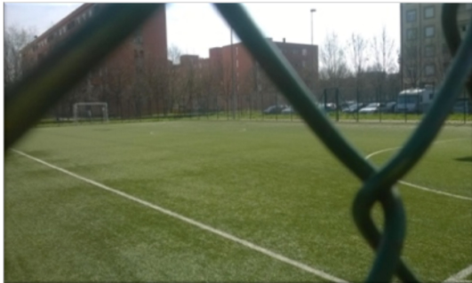
Campo da calcio a 5 Pomari