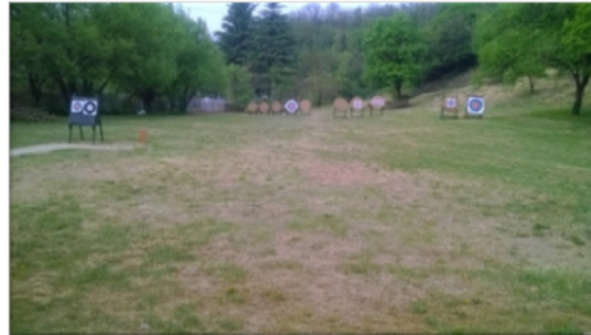
Tiro con l'Arco