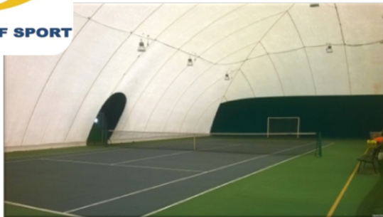
Circolo Tennis via Monte Zebio