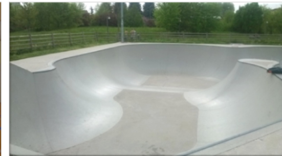
Skate Park Parco Fornaci