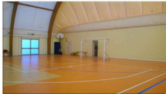
Tensostruttura di Maddalene