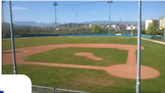
Stadio del baseball Pomari