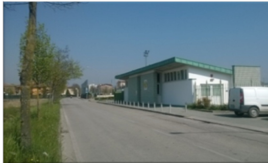
Ingresso struttura di via Rolle