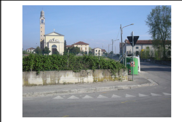
Via San Cristoforo