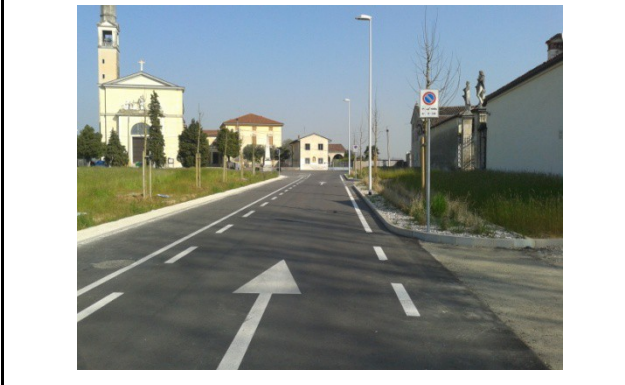
Nuova via San Cristoforo