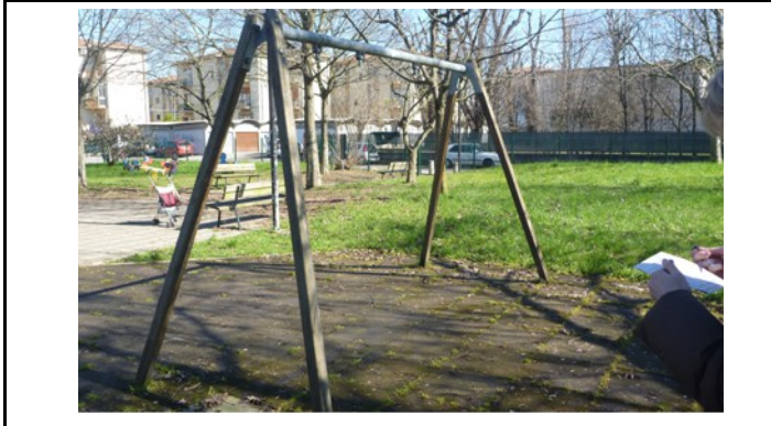
PG Piovene Remondini (prima)