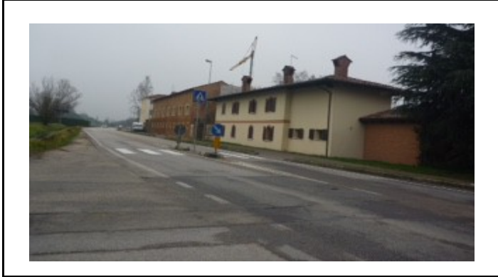
Strada di Bertesima