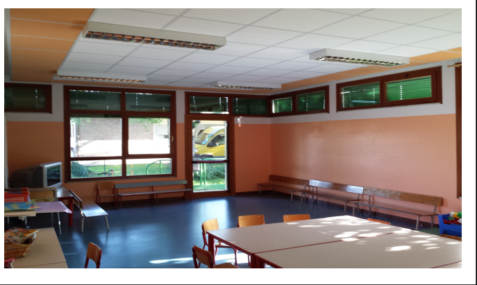
Scuola Materna Piccoli