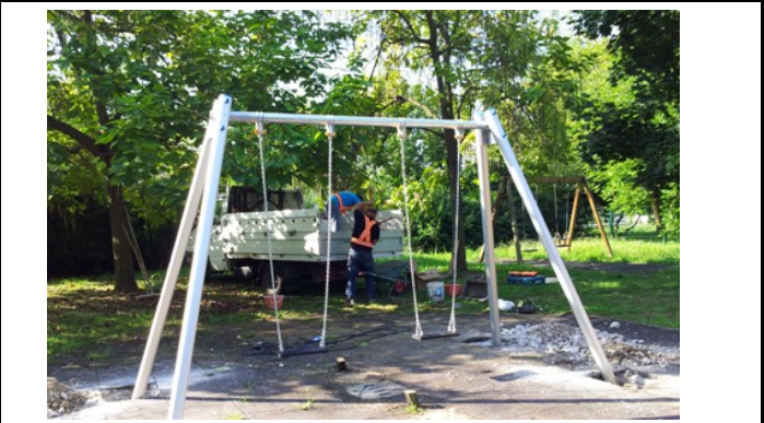
PG Piovene Remondini (dopo)