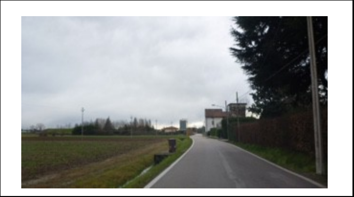
Strada di Bertesinella