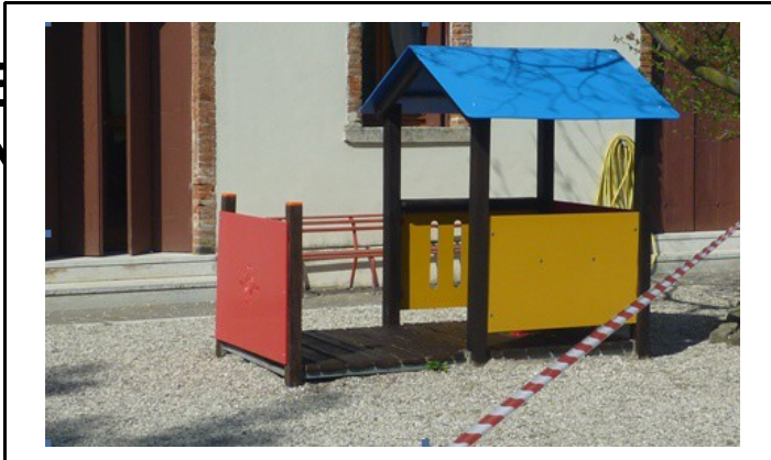
Scuola dell'infanzia Piccoli