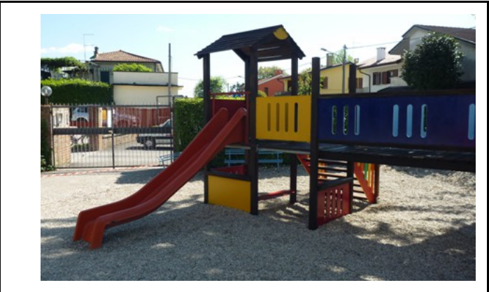
Scuola dell'infanzia Piccoli