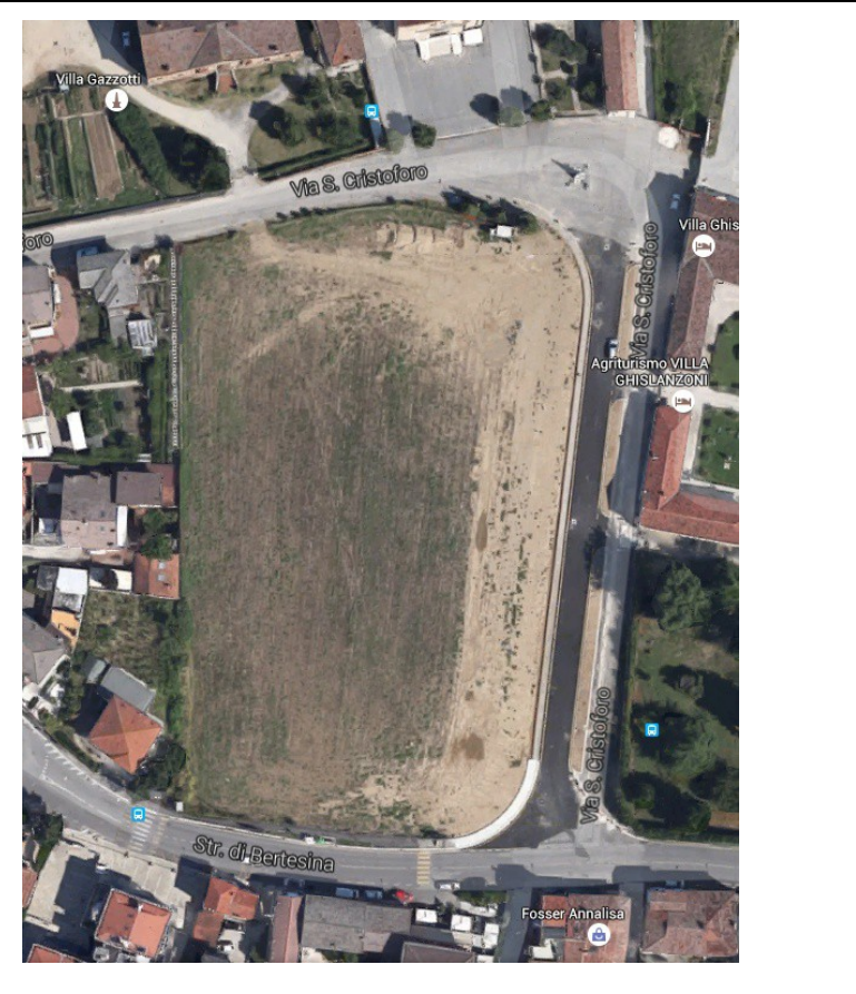
Area per futura Piazza di Bertesina