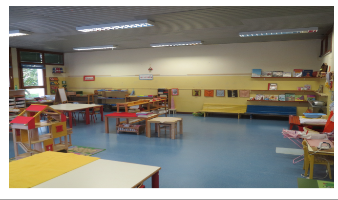
Scuola Materna Piccoli